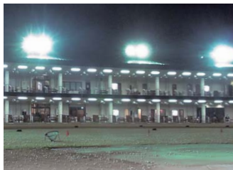
ジャックニクスゴルフセンター大森(130YD、10台)