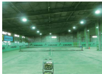
平井健一テニスカレッジ(2面、24台)